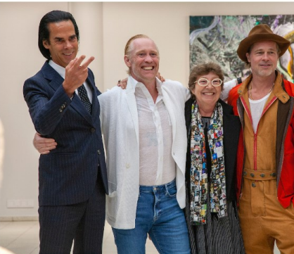
Nick Cave (vas.), Thomas Houseago sekä Brad Pitt virallisessä poseerauksessa.